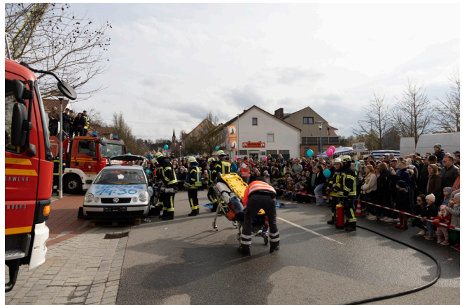
Schauübung der Feuerwehr und des BRK am Rottenburger Fastenmarkt

Wenn die Blumen, Sträucher und Bäume wieder blühen und die Bienen zu summen beginnen, ist Frühling. Die Tage werden wieder spürbar länger, die Natur erwacht aus dem Winterschlaf und strotzt gerade vor Energie. Und auch uns Menschen verleiht diese Jahreszeit hoffentlich neuen Antrieb, Motivation und Aufbruchstimmung anstatt der immer wieder zitierten Frühjahrsmüdigkeit.