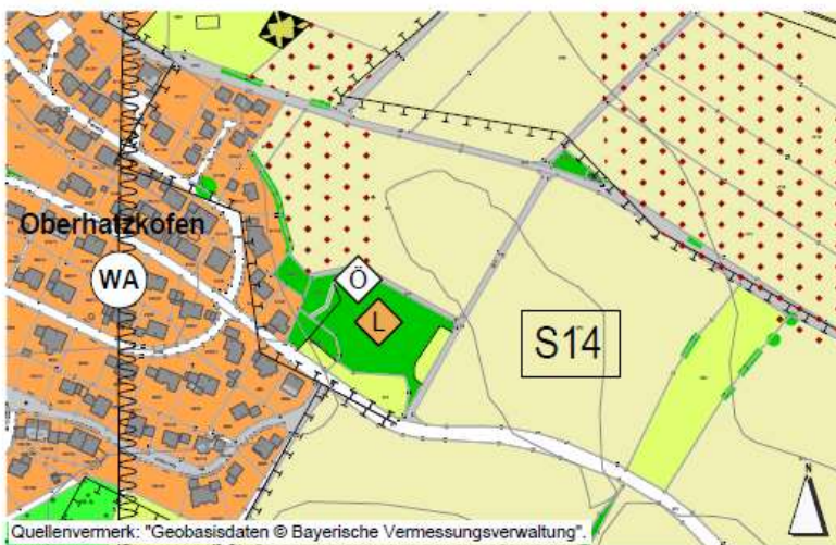
Ausschnitt aus dem rechtsgültigen Flächennutzungsplan der Stadt Rottenburg a. d. Laaber, Ortsteil Oberhatzkofen

Das Planungsgebiet befindet sich zwischen der Birkenstraße und der Hochleite am östlichen Ortsrand von Oberhatzkofen und umfasst folgende Flurnummern, jeweils Gemarkung Nhk: 871/38, 871/39, 871, 972 (Teilbereich), 914 (Teilbereich) und 873 (Teilbereich). Die Gesamtfläche des Geltungsbereichs beträgt ca. 2 Hektar. Der Geltungsbereich und die Umgrenzung ergeben sich aus dem beigefügten Lageplan.